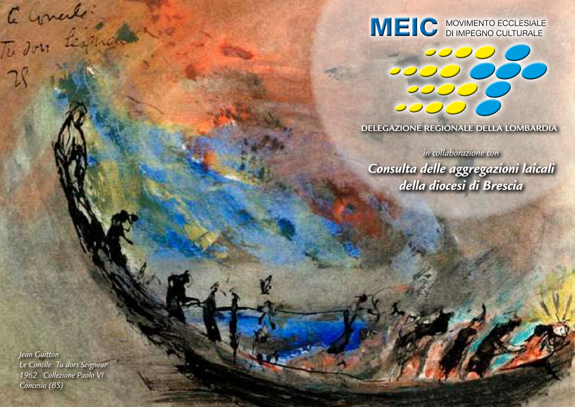
Jean Guilton Le Concile: Tu dors Seigneur 1962 · Collezione Paolo VI Concesio (BS)

MEIC MOVIMENTO ECCLESIALE DI IMPEGNO CULTURALE