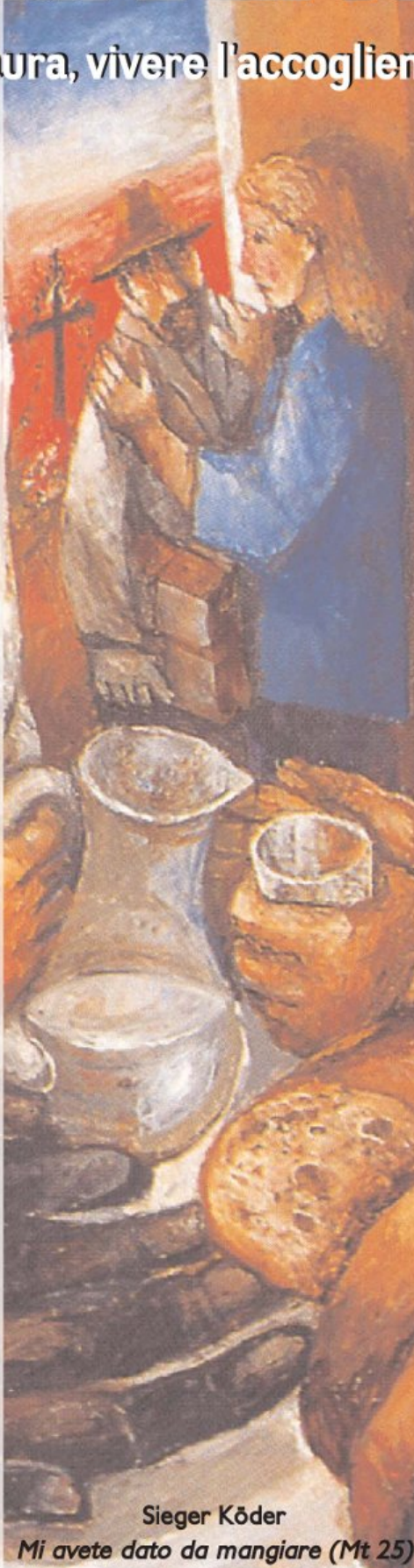
Sieger Köder Mi avete dato da mangiare (Mt 25)